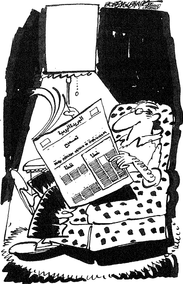
Bob Englehart, The Hartford Courant

« بريشة بوب انجلهارت - من صحيفة ذي هارتفورد كورانت »