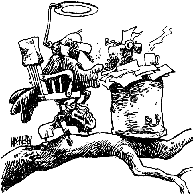
Jeff MacNelly, The Richmond News Leader

« بريشة جيف ماكينالي - من صحيفة ذي ريتشموند نيوز ليدر »