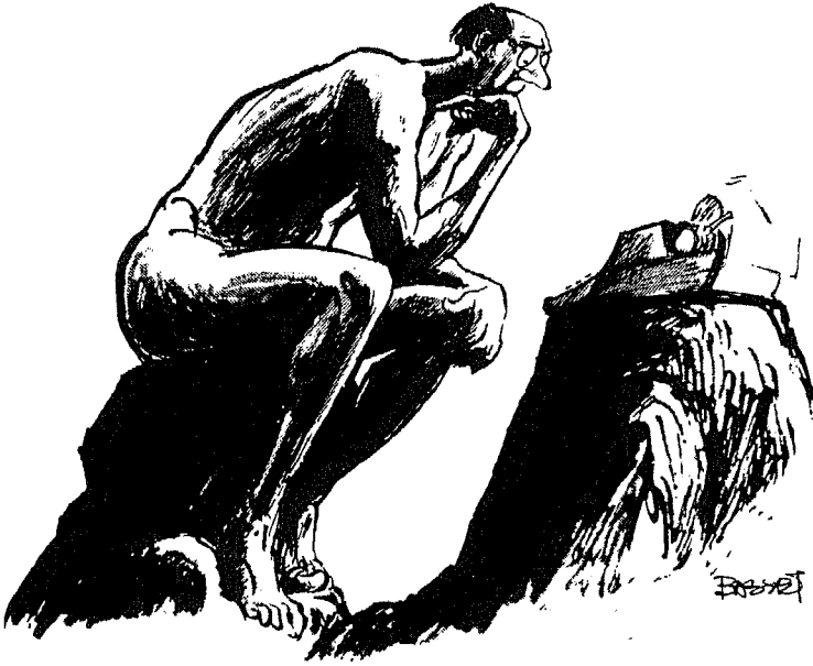
Gene Basset, Scripps-Howard Newspapers

« بریشه چین باسیت - من صحف سکریس - هاررد »