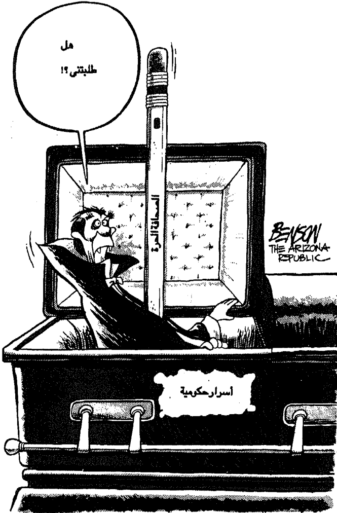
Steve Benson, The Arizona Republic

« بريشة ستيف بنسون - من صحيفة أريزونا ريبابليك »